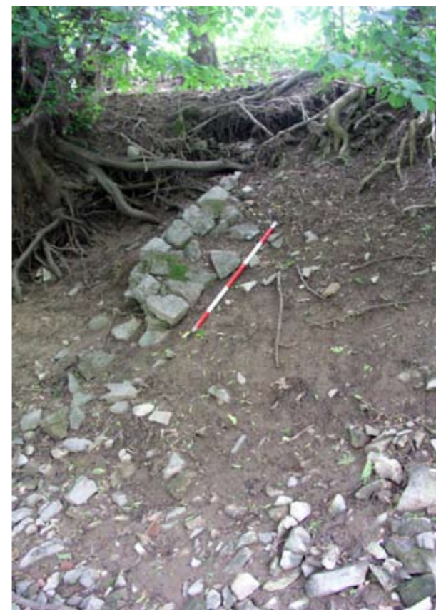
Sl. 5: Zrušen del rimskega zidu na brežini Ljubljane, nekaj deset metrov nizvodno od lesenih pilotov Fig. 5: Collapsed part of the Roman wall on the bank slope of the Ljubljana, several tens of metres downstream from the wooden piles

Čeprav je bil promet po Ljubljani pomemben skozi vse rimsko obdobje, se je vloga Navporta od sredine 1. st. po Kr. močno zmanjšala. Sprememba je bila verjetno povezana s povečanim prometom po cesti Aquileia–Emona, ki je bila zgrajena konec 1. st. pr. Kr. ali na začetku 1. st. po Kr., z vzponom kolonije Emone in celo z vojaško reorganizacijo na območju srednjega Podonavja. Postojanka na Dolgih njivah je bila opuščena v mirnem obdobju 1. st. po Kr., jedro Navporta pa se je preneslo na prometno ugodnejše območje Breg, ki leži ob rimski cesti zahodno od Ljubljane. Tam so v drugi polovici 1. st. in v 2. st. stala velika skladišča, vendar drugačne oblike kot starejša na Dolgih njivah ter brez sledov obrambne arhitekture. 34 Poznorimska naselbina (Breg) in utrdbe (Gradišče, Turnovšče, Ajdovski zid) na območju Navporta so bile zapuščene najpozneje v prvi polovici 5. st., tako kot večina nižinskih naselij v jugovzhodnoalpskem prostoru. Tudi promet po nekdanji magistrali skozi Navport je zamrl. 35