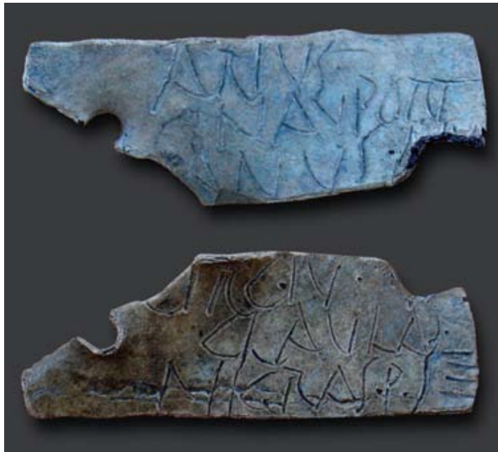
Sl. 3: Svinčena etiketa z vrezanim napisom, na katerem je omenjen Arius iz Navporta ( Arius Nauportanus ), naročnik žebljev v kovaški delavnici. Vel. 3,9 x 1,4 cm. Izkopavanja na Bregu (Kočevarjev vrt) leta 2005. Prva polovica 1. st. po Kr. (Lovenjak 2009) Fig. 3: Lead label with incised inscription mentioning an Arius Nauportanus who ordered nails in a blacksmith's workshop. Size 3.9 x 1.4 cm. Excavations at Breg (Kočevarjev vrt) in 2005. First half of the 1st century AD (Lovenjak 2009)

Sodeč po drobnih najdbah (pozne oblike italske keramike s črnim premazom) je bila naselbina v celotnem obsegu najverjetneje zgrajena v četrtem ali tretjem desetletju pr. Kr. Rimska in keltska keramika pa pričata o mešanem prebivalstvu, rimskih priseljencih in keltskih staroselcih. Drobnu arheološko gradivo nadalje kaže, da je postojanka na Dolgih njivah delovala predvsem v obdobju vladavine cesarja Avgusta (27 pr. Kr. do 14 po Kr.), potem pa je bila opuščena. 26 Obstoje naselbine na Dolgih njivah sodi torej v obdobje, ko so Rimljani osvajali Alpe, Balkan in srednje Podonavje. 30 Velika skladišča dokazujejo, da to ni bila običajna rimska naselbina, temveč utrjena prekladalna postaja, prek katere sta potekala tranzitni promet in trgovina. Velikost naselbine in razsežnost skladišč pričata o izjemni količini tovorov. 31 Navport je moral igrati pomembno vlogo v oskrbi legij na prostoru srednjega Podonavja in severnega Balkana. Vojaške transporte po Ljubljani in Savi v avgustejskem obdobju dokazujejo najdbe vojaškega materiala v Ljubljani 32 in vojaški tabori, ki ležijo vzdolž rečne poti proti vzhodu, v Emoni ter na območju Brežiških vrat. Kaže, da je bila oskrba legij vsaj deloma v rokah akvilejskih trgovcev. 35