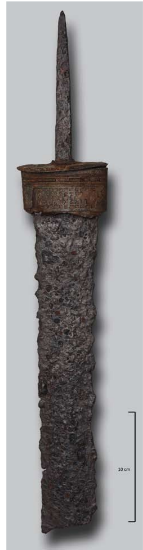
Sl. 6: Rimski meč ( gladius ) z ostankom medenina-stega okova nožnice z rastlinskim motivom, izvedenim v predrti tehniki (Gaspari, Erič 2008c: 302; Gaspari 2010: 92, sl. 53) Fig. 6: Roman sword ( gladius ) with the remains of a brass scabbard fitting bearing a plant motif executed in openwork technique (Gaspari, Erič 2008c: 302; Gaspari 2010: 92, fig. 53)