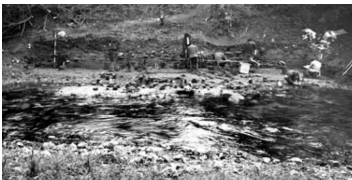
Sl. 4: V okolici pilotov domnevne nakladalne ploščadi v strugi Ljubljane so bili odkriti številni odlomki tegul in imbreksov, fragmentirano in celo keramično posodje, železne žvale in kosti ter novci iz časa med avgustejskim obdobjem in koncem 4. stoletja n. št. V osi trasirke je bil leta 2006 odkrit del gladija na sliki 6, ki dopolnjuje bogato zbirko zgodnjerskega orožja iz struge vzdolž Dolgih njiv Fig. 4: The supposed loading platforms around the piles. The riverbed of the Ljubljana revealed numerous fragments of tegulae and imbrices, fragmented and complete ceramic vessels, iron bits, bones and coins dating from the Augustan period to the end of the 4th century AD. In 2006, part of a gladius on the figure 6 was found in the axis of the measuring rod, adding to the rich collection of Early Roman weapons from the riverbed along Dolge njive

Sodeč po drobnih najdbah (pozne oblike italske keramike s črnim premazom) je bila naselbina v celotnem obsegu najverjetneje zgrajena v četrtem ali tretjem desetletju pr. Kr. Rimska in keltska keramika pa pričata o mešanem prebivalstvu, rimskih priseljencih in keltskih staroselcih. Drobnu arheološko gradivo nadalje kaže, da je postojanka na Dolgih njivah delovala predvsem v obdobju vladavine cesarja Avgusta (27 pr. Kr. do 14 po Kr.), potem pa je bila opuščena. 26 Obstoje naselbine na Dolgih njivah sodi torej v obdobje, ko so Rimljani osvajali Alpe, Balkan in srednje Podonavje. 30 Velika skladišča dokazujejo, da to ni bila običajna rimska naselbina, temveč utrjena prekladalna postaja, prek katere sta potekala tranzitni promet in trgovina. Velikost naselbine in razsežnost skladišč pričata o izjemni količini tovorov. 31 Navport je moral igrati pomembno vlogo v oskrbi legij na prostoru srednjega Podonavja in severnega Balkana. Vojaške transporte po Ljubljani in Savi v avgustejskem obdobju dokazujejo najdbe vojaškega materiala v Ljubljani 32 in vojaški tabori, ki ležijo vzdolž rečne poti proti vzhodu, v Emoni ter na območju Brežiških vrat. Kaže, da je bila oskrba legij vsaj deloma v rokah akvilejskih trgovcev. 35